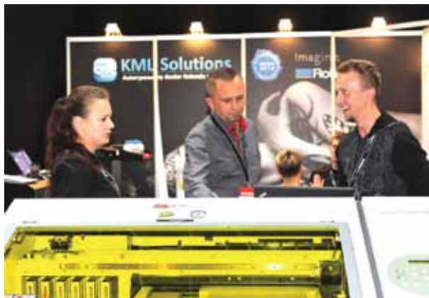
Stoisko firmy KML Solutions