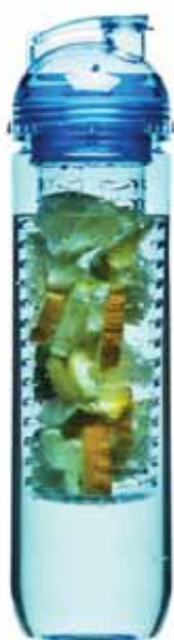
Bidon z pojemnikiem na owoce, Sagaform, Texet Poland; Super Gift 2014

Firma Key2Print objaśniała zainteresowanym nowe funkcje systemu sprzedaży Key2Print, które pomagają promować sklep w Internecie, budzić zainteresowanie klientów i utrzymać ich lojalność.